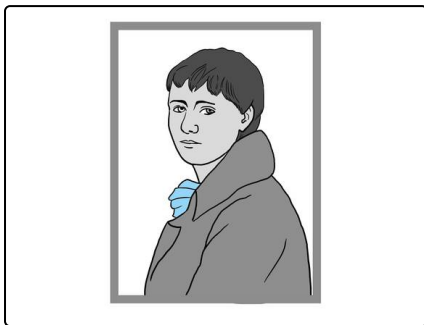
Heinrich von Kleist (1777-1811)

Fülle die Lücken mit den richtigen Elementen aus.